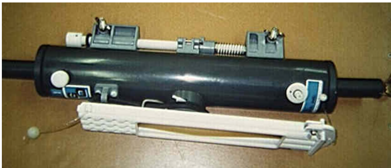
Bouteille Niskin avec Porte-thermomètre pour 3 thermomètres.